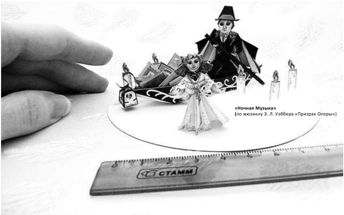
«Ночная Музыка» (по мюзиклу Э. Л. Уэббера «Призрак Оперы»)

Следую девизу: «При желании даже простыми средствами можно сотворить маленькое чудо и добиться большого успеха». Показываю, что каждое любимое (а не только модное или дорогостоящее) занятие можно сделать настоящим искусством. Стараюсь порадовать и вдохновить людей. Миниатюры хранят тепло пальцев и светлые мысли.