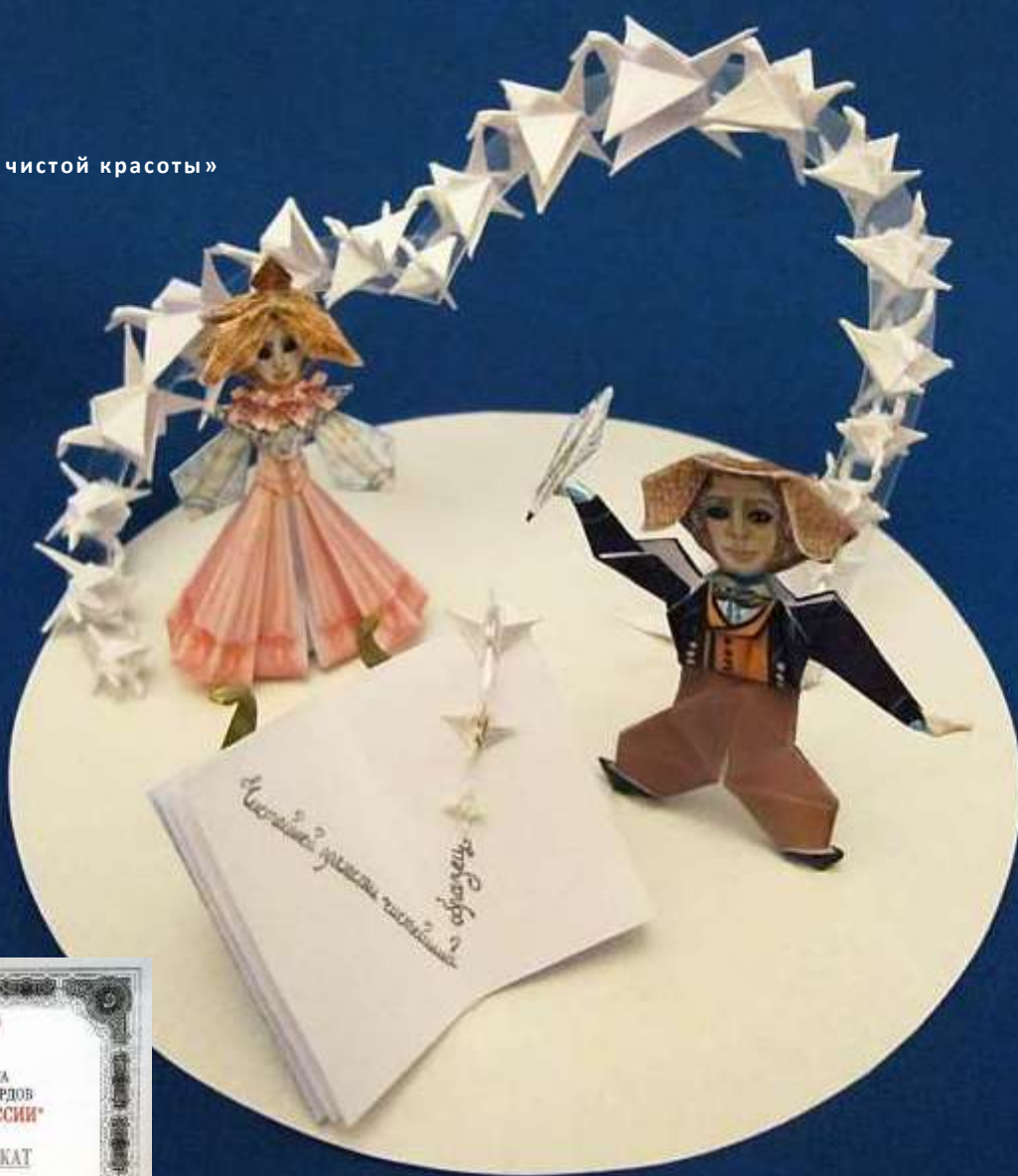
«Гений чистой красоты»