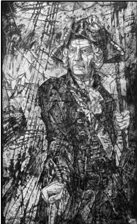
Капитан-командор Витус Беринг